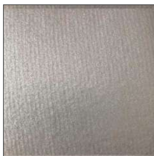
FR 9 (flame retardant)