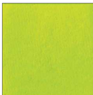
NEON YELLOW 4